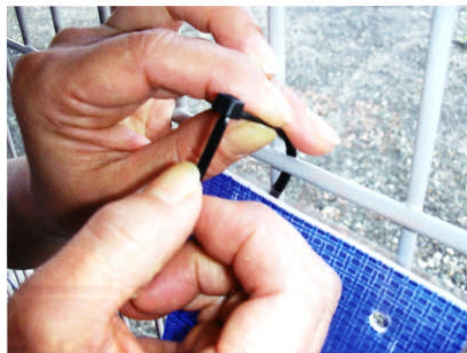
② 取付けバンドの差し込む方向に注意して下さい。