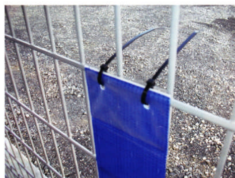
④ 根元までしっかりと差し込み強く引っ張って固定して下さい。