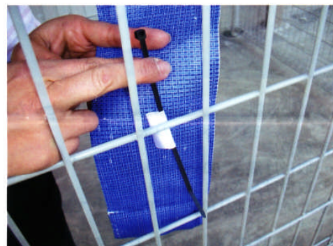
⑤ 亥旦停止 裏側のループ(白)に固定バンドを通して取り付けて下さい。